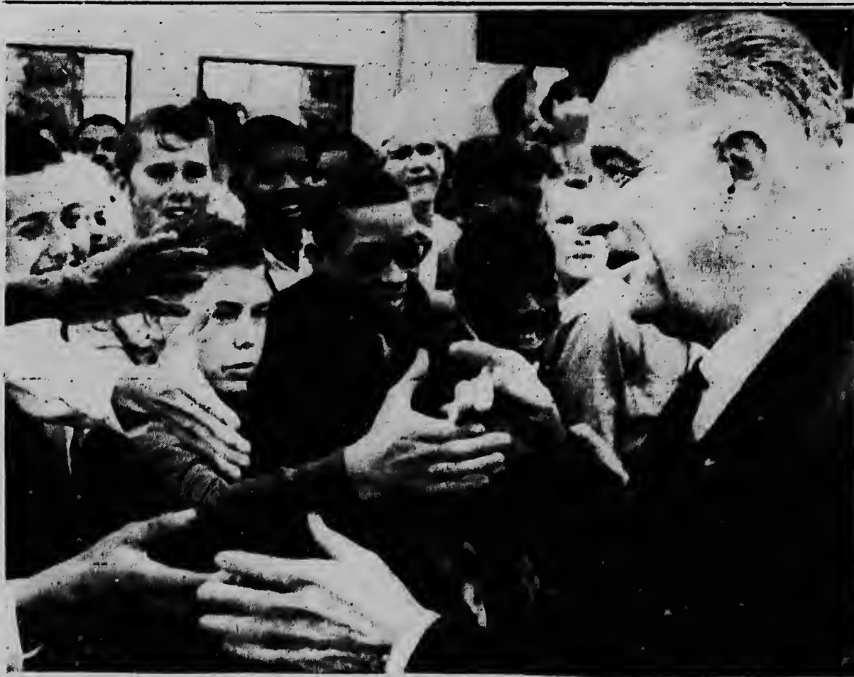
SAN MARCOS -- Riba e foto aki nos por mira presidente Lyndon B. Johnson entre un multitud di mucha enorme na caminda pa firma un tratado di 2,6 bilion dollar den e ciudad aki.

Johnson a interna di loke a pasa mas o menos 6,15 di mainta, y mes ora el a yama e secretario di defensa pa duna instruccion pa duna familia di Eisenhower tur asistencia di gobierno.